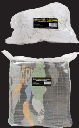
Hvit 1 kg pose

101 TØYFILLER 1 KG BOMULL HVIT og 101 TØYFILLER 10 KG BOMULL KULØRTE er laget av T-skjorter etc. i 100% bomull. Loer ikke og er velegnet for generell rengjøring, verksteder, maskiner, malere og for rengjøring med løsemidler og kjemikalier.