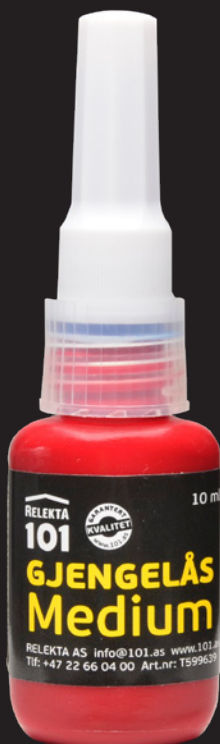
10 ml flaske

101 GJENGELÅS MEDIUM er et universalt middel for alle typer metaller til skruesikring, gjengesikring, flatetetning/pakning, lagerinnfesting, tetting av rørkoblinger etc.